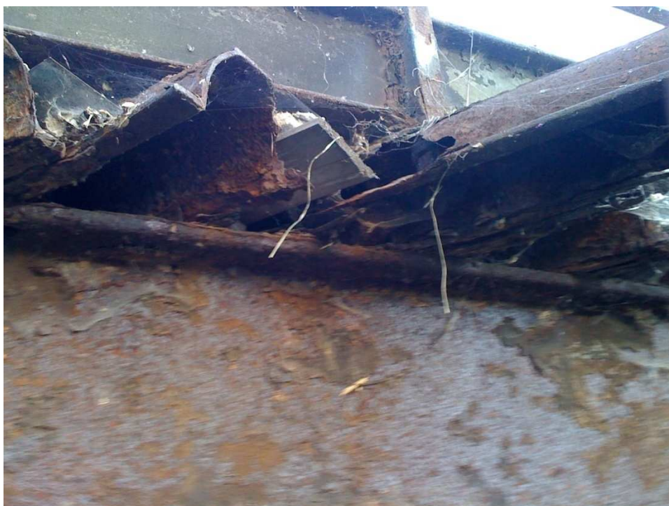
Fot.5 Widok od strony górnej wody . Całkowite zniszczenie kształtowników Zoresa