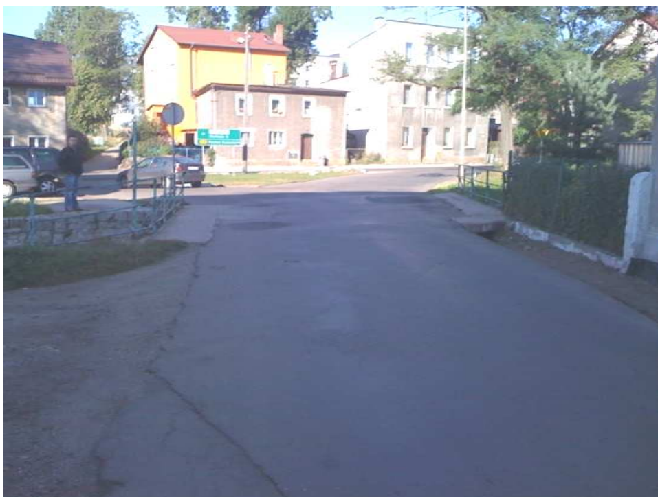
Fot.3 Ogólny widok mostu z ul. Kościuszki