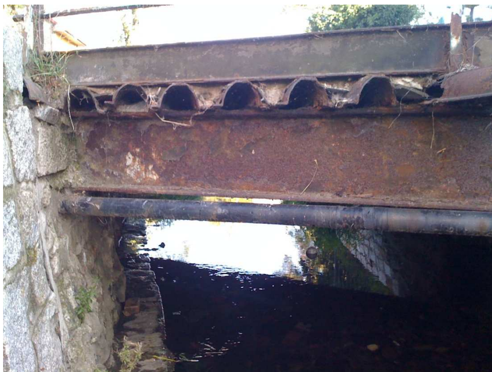
Fot.4 Widok od strony górnej wody na bok konstrukcji przy przyczółku