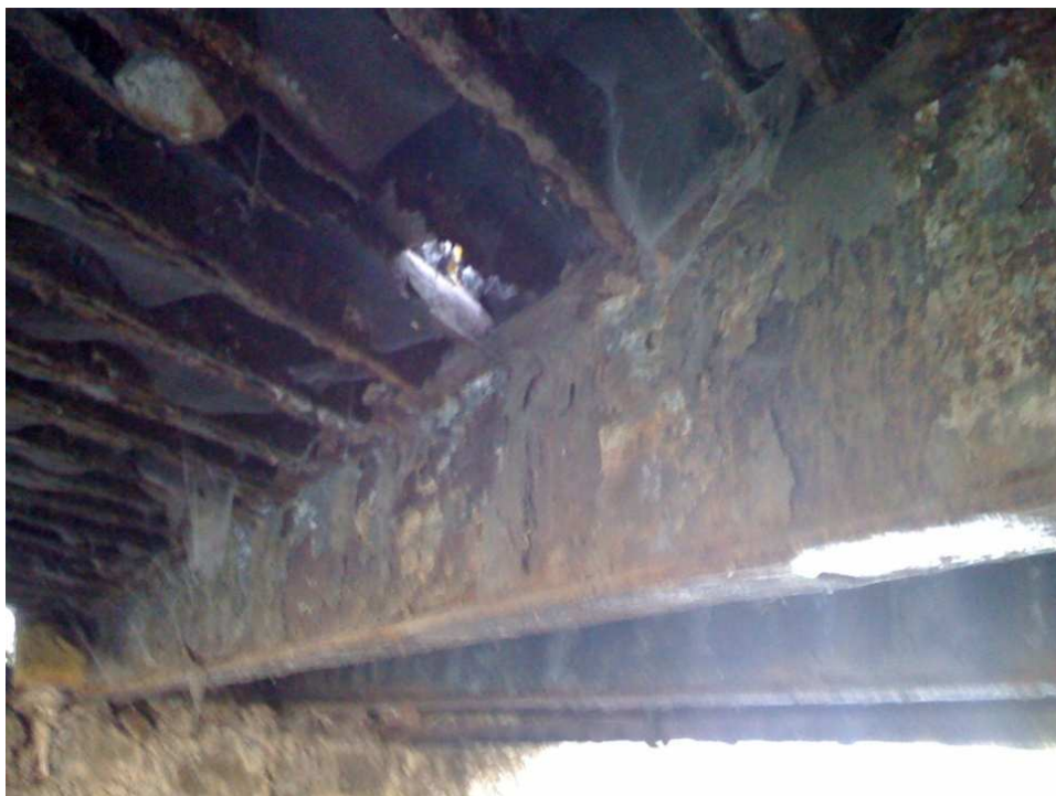
Fot.6 Widok od spodu mostu. Całkowite zniszczenie i przemieszczenie pionowe kształtowników Zoresa , zaawansowana korozja dźwigarów głównych. Widoczne nieszczelności pomostu.