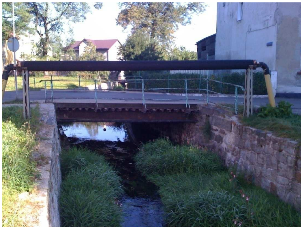
Fot.1 Widok mostu od strony górnej wody