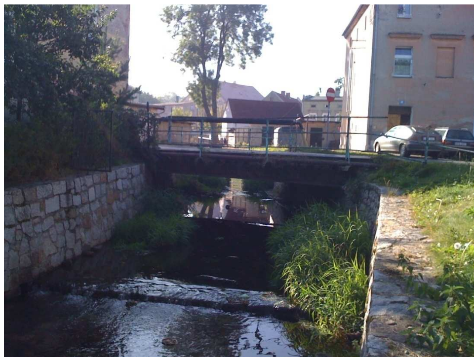
Fot.2 Widok mostu od strony dolnej wody