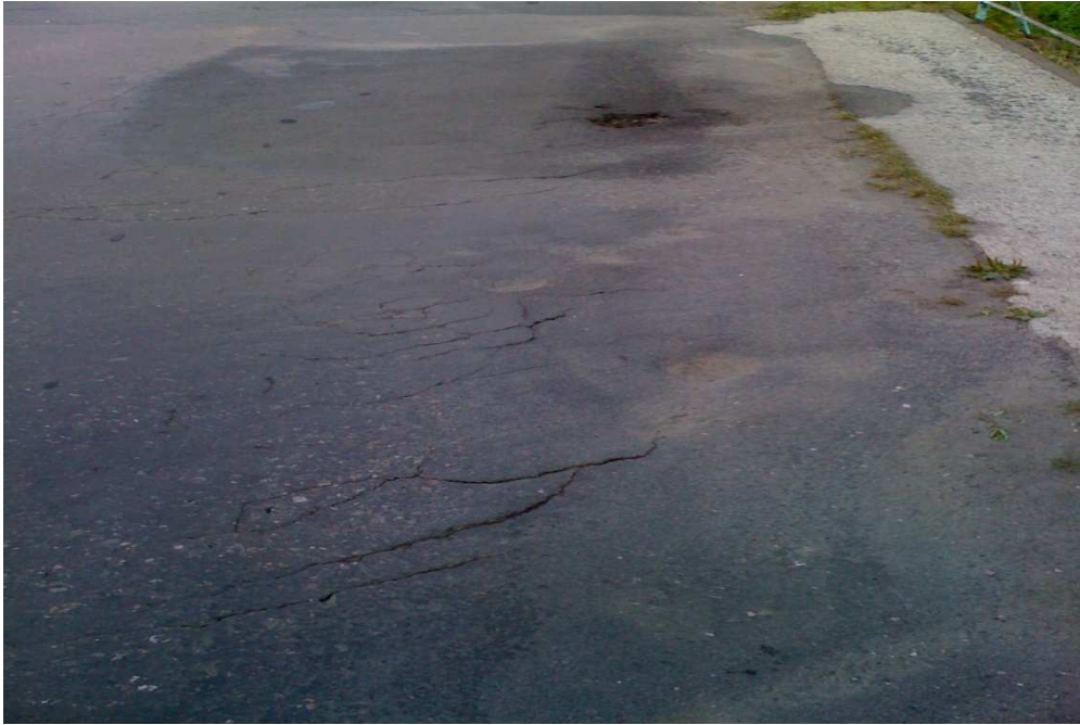
Fot. 9 Stan nawierzchni mostu - liczne pofałdowania i spękania spowodowane załamaniem się pomostu.