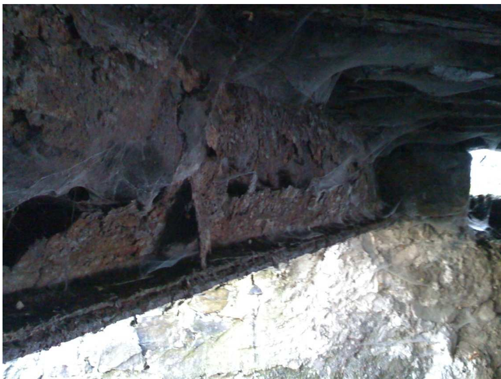
Fot.7 Widok na zniszczony dźwigar główny. Rozwarstwienie pasa dolnego, ubytki środnika