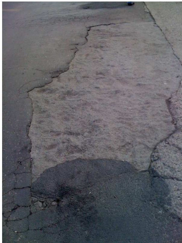
Fot. 10 Stan nawierzchni mostu - lokalne wzmocnienia i uzupełnienia pomostu betonem